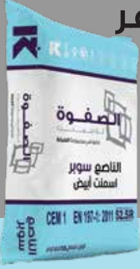
50 Kg Bag

لأستخدام الخرسانة والخلطة والجص الاسمنتي التي تحتوي على الناصع سوبر يجب ان تكون محددة ويتم استخدامها بشكل صحيح من أجل الحصول على الأداء الأفضل