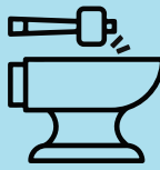
ذو قوة متينة ومتناسقة تطابق جميع المعايير